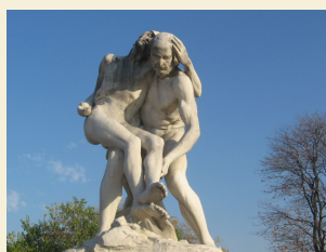
Le Bon Samaritain François Sicard 1905

Manquent : l'auriculaire et l'annulaire de la main gauche l'index de la main droite, dans la main un objet cassé qui ressemble à un vase ?