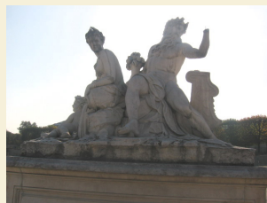
La Loire et le Loiret Corneille Van Cleve 1707

...6 mains dont les doigts manquent, 8 pieds et quelques orteils, 1 bras, 5 avant bras, 2 mains cassées au poignet, 5 têtes d'enfant, 1 torse d'enfant, 3 sexes d'homme, 2 nez mais aussi 1 bec de cygne, 1 tête de crocodile, le sabot d'un centaure... (il ne manque qu'un raton laveur)